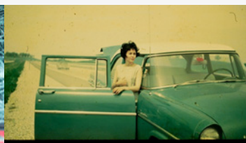
MARIN DES MONTAGNES