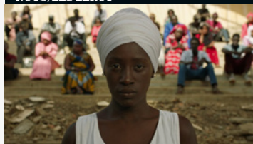
XALÉ, LES BLESSURES...