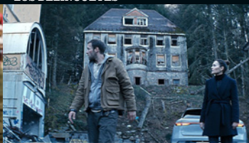
LE MANGEUR D'ÂMES