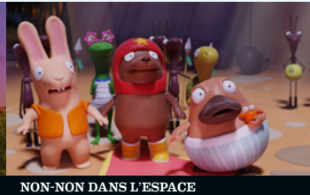
NON-NON DANS L'ESPACE